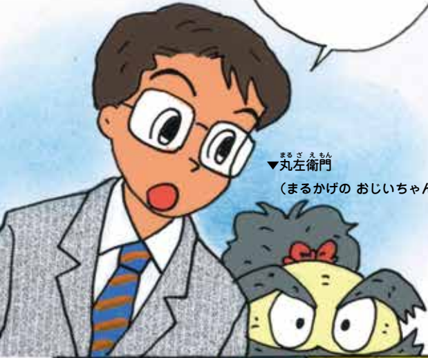
まるざえもん ▼丸左衛門 (まるかげのおじいちゃん)