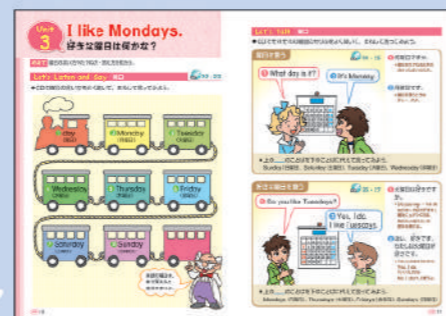
小学ポピー4年生教材イメージ ※内容・デザインは変わる場合があります。

『ポピー Kids English』で体験した言葉や表現に授業で取り組み、 さらに家で繰り返し、より確実に身につけていきます!